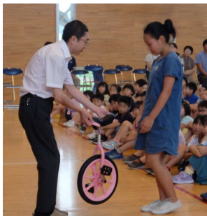
一輪車贈呈式 (大森小学校体育館)

本会では学校教育の振興を目的に、旧大森町内の全小中学校へ学校図書454冊を贈り、平成12年には秋田県内小学校・中学校・