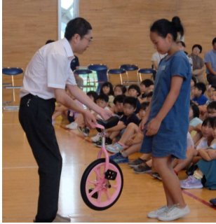
一輪車贈呈式 (大森小学校体育館)

本会では学校教育の振興を目的に、旧大森町内の全小中学校へ 学校図書454冊を贈り、平成12年には秋田県内小学校・中学校